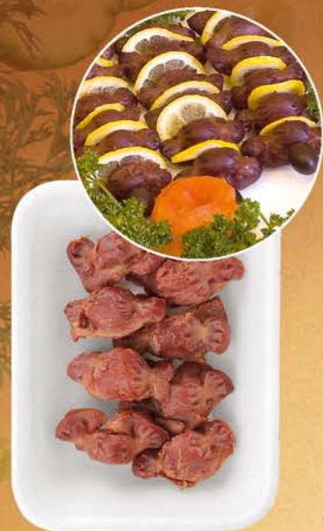
Желудочки «ВКУСНЯТИНА» варено-копченые (300 г)

Состав: желудки куриные, соль поваренная пищевая, специи. Пищевая и энергетическая ценность: жиры – 17%, белки – 5% калорийность – 175 ккал Условия и срок хранения: при t не выше +2+6°C не более 7 суток