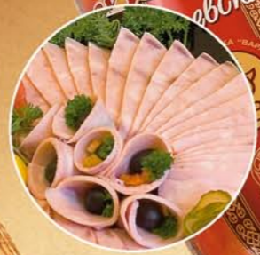
Ветчина «ЮРЬЕВСКАЯ» вареная

Состав: мясо птицы, соль поваренная пищевая, фосфаты. Начинка: курага, чернослив. Пищевая и энергетическая ценность: жиры – 25%, белки – 12% калорийность – 278 ккал Условия и срок хранения: при t не выше +2+6°C не более 7 суток