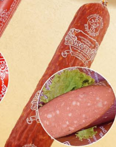
Колбаса «ЗАКАЗНАЯ» полукопченая

Состав: мясо птицы, шпик хребтовый, соль поваренная пищевая, многофункциональная комплексная добавка, фиксатор окраски. Пищевая и энергетическая ценность: жиры – 33%, белки – 12% калорийность – 357 ккал Условия и срок хранения: при t не выше +2+6°C не более 15 суток