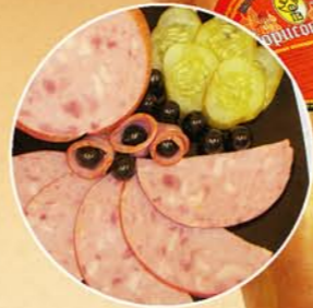
Ветчина «БОРИСОВСКАЯ» вареная (н/об)

Состав: мясо птицы, соль поваренная пищевая, комплексная смесь специй, фиксатор окраски. Пищевая и энергетическая ценность: жиры – 28%, белки – 12% калорийность – 306 ккал Условия и срок хранения: при t не выше +2+6°C не более 15 суток