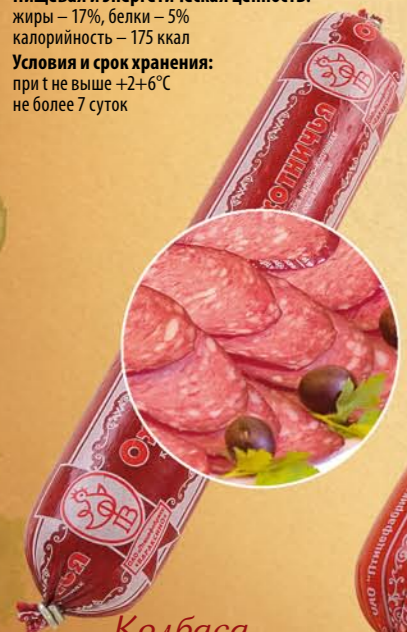
Колбаса «ОХОТНИЧЬЯ» варено-копченая

Состав: мясо птицы, шпик хребтовый, соль поваренная пищевая, комплексная добавка, фиксатор окраски. Пищевая и энергетическая ценность: жиры – 35%, белки – 12% калорийность – 375 ккал Условия и срок хранения: при t не выше +2+6°C не более 15 суток