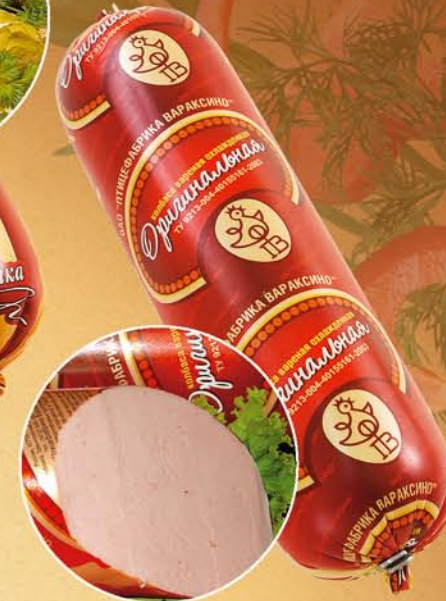
Колбаса «ОРИГИНАЛЬНАЯ» вареная

Состав: мясо птицы, шпик, крахмал картофельный, яичный порошок, паприка, многофункциональная комплексная добавка, соль поваренная, фиксатор окраски. Пищевая и энергетическая ценность: жиры – 24%, белки – 12% калорийность – 269 ккал Условия и срок хранения: при t не выше +2+6°C не более 15 суток