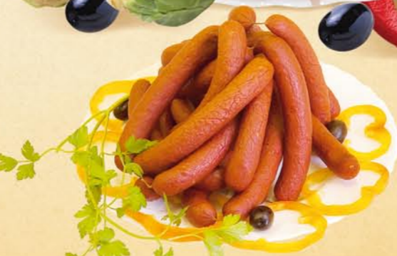
Колбаски «К ПИВУ» полукопченые

Состав: мясо птицы, сыр твердый, соль поваренная пищевая, многофункциональная комплексная добавка, фиксатор окраски. Пищевая и энергетическая ценность: жиры – 32%, белки – 11% калорийность – 345 ккал Условия и срок хранения: при t не выше +2+6°C не более 15 суток