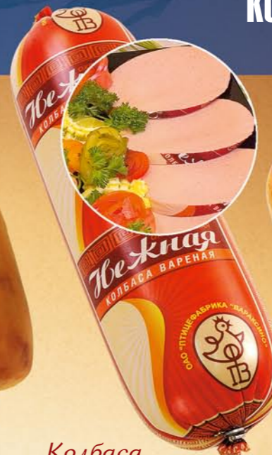
Колбаса «НЕЖНАЯ» вареная

Состав: мясо птицы, соль поваренная пищевая, комплексная смесь специй, фиксатор окраски. Пищевая и энергетическая ценность: жиры – 28%, белки – 12% калорийность – 303 ккал Условия и срок хранения: при t не выше +2+6°C не более 4 суток