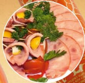
Ветчина «СМИРНОВСКАЯ» вареная

Состав: мясо птицы, соль поваренная пищевая, комплексная смесь специй, фиксатор окраски. Пищевая и энергетическая ценность: жиры – 30%, белки – 11% калорийность – 318 ккал Условия и срок хранения: при t не выше +2+6°C не более 15 суток