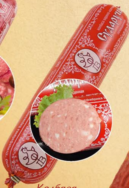
Колбаса «СУДАРУШКА» варено-копченая

Состав: мясо птицы, шпик хребтовый, соль поваренная пищевая, комплексная добавка, фиксатор окраски. Пищевая и энергетическая ценность: жиры – 35%, белки – 12% калорийность – 375 ккал Условия и срок хранения: при t не выше +2+6°C не более 15 суток