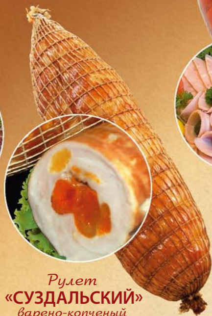
Рулет «СУЗДАЛЬСКИЙ» варено-копченый с курагой

Состав: желудки куриные, соль поваренная пищевая, специи. Пищевая и энергетическая ценность: жиры – 17%, белки – 5% калорийность – 175 ккал Условия и срок хранения: при t не выше +2+6°C не более 7 суток