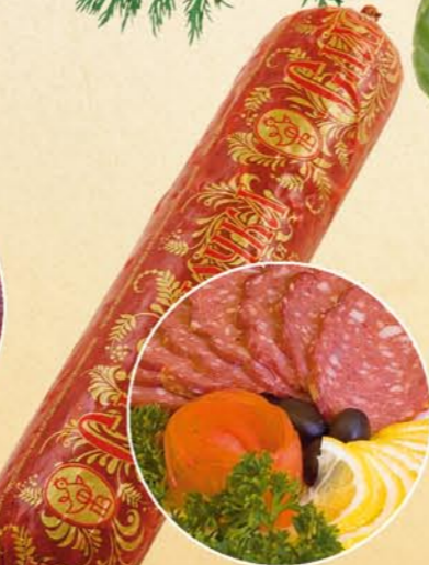
Колбаса «СЛАВЯНОЧКА» полукопченая

Состав: мясо птицы, фарш куриный, шпик хребтовый, соль поваренная пищевая, многофункциональная комплексная добавка, фиксатор окраски. Пищевая и энергетическая ценность: жиры – 30%, белки – 10% калорийность – 315 ккал Условия и срок хранения: при t не выше +2+6°C не более 15 суток