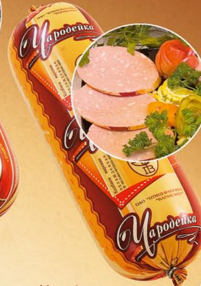
Колбаса «ЧАРДЕЙКА» вареная

Состав: мясо птицы, сухое молоко, мука пшеничная, яичный белок, соль поваренная пищевая, вкусоароматические добавки, фиксатор окраски. Пищевая и энергетическая ценность: жиры – 20%, белки – 13% калорийность – 237 ккал Условия и срок хранения: при t не выше +2+6°C не более 15 суток